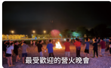
最受歡迎的營火晚會