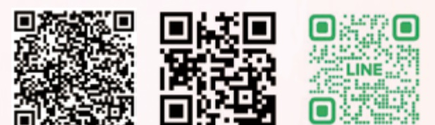
真佛報臉書 | 真佛報網站連結 | 加 LINE@ 好友

歡迎同門、分堂多加利用真佛報網站，閱讀及投稿，更歡迎加入真佛報 LINE@ 好友，一起護持真佛報，讓真佛報陪您一起修行。