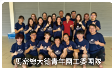
馬密總大德青年團工委團隊