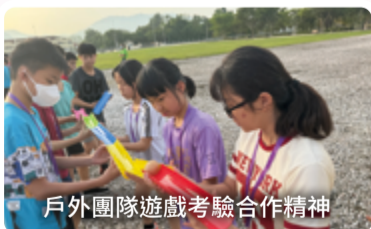
戶外團隊遊戲考驗合作精神