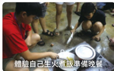
體驗自己生火煮飯準備晚餐