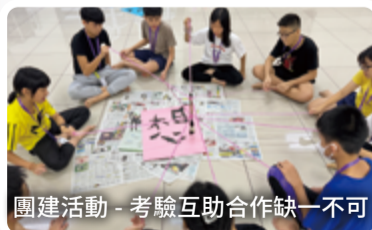
團建活動 - 考驗互助合作缺一不可