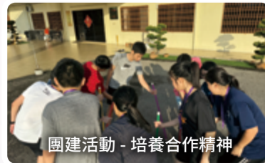
團建活動 - 培養合作精神