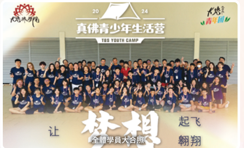
讓夢想 起飞 翱翔 全體學員大合照