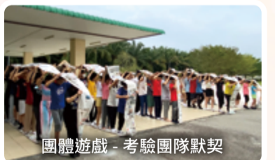
團體遊戲 - 考驗團隊默契