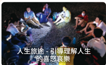
人生旅途 - 引導理解人生的喜怒哀樂