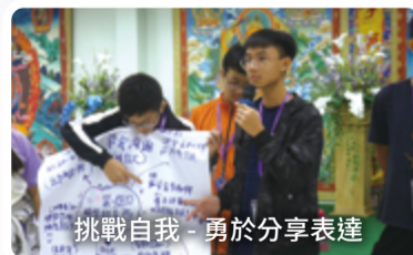
挑戰自我 - 勇於分享表達